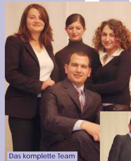
Das komplette Team